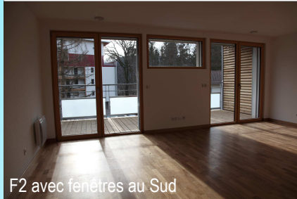
F2 avec fenêtres au Sud

Menuiserie intérieure, parquets et équipements de cuisine : MEAM (Saint Dié - 88)