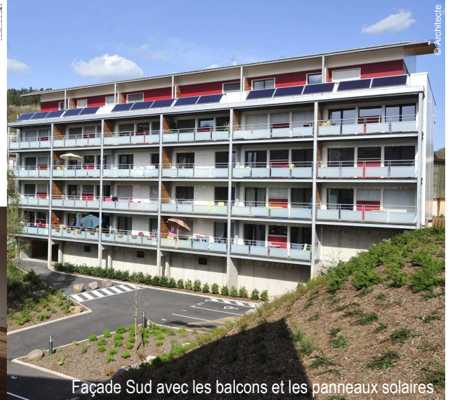
Façade Sud avec les balcons et les panneaux solaires