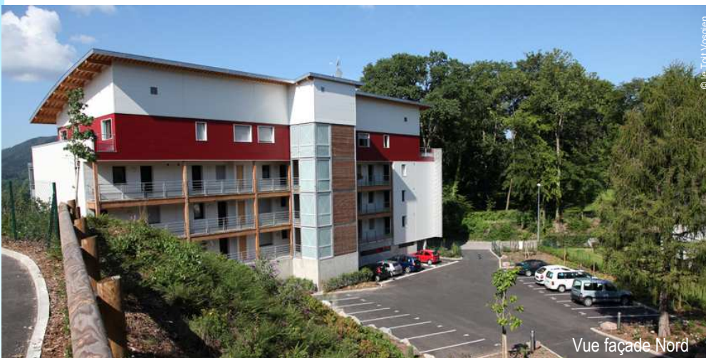
Vue façade Nord

Le projet se compose de 2 bâtiments collectifs à structure bois comprenant respectivement 17 et 13 logements. La construction de 5 niveaux en ossature bois avec un attique constitue une vraie performance. L'établissement de ces logements sociaux est à l'origine d'un titre V dans la réglementation thermique. En effet, une innovation a été introduite: un système solaire thermique combiné collectif individualisé. L'objectif du maître d'ouvrage ici, est de développer l'énergie positive.